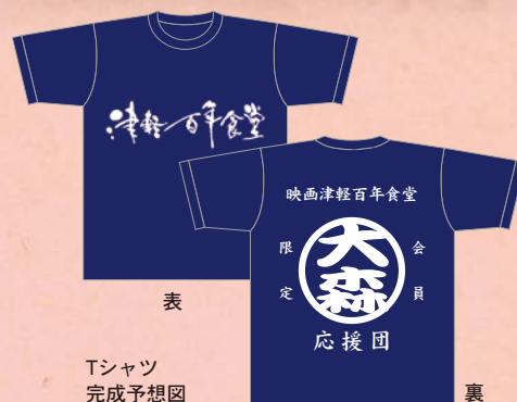
Tシャツ 完成予想図