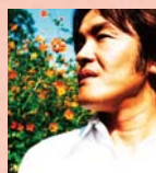
坂本サトル (ミュージシャン)