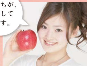
応援団長「りんご娘」レットゴールド