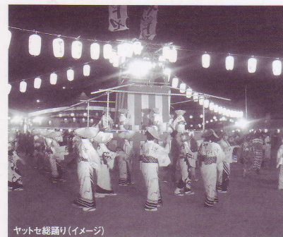
ヤットセ総踊り(イメージ)