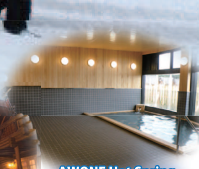
AWONE Hot Spring