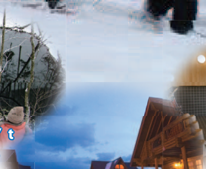
AWONE Shirakami-Jyuniko Cottages