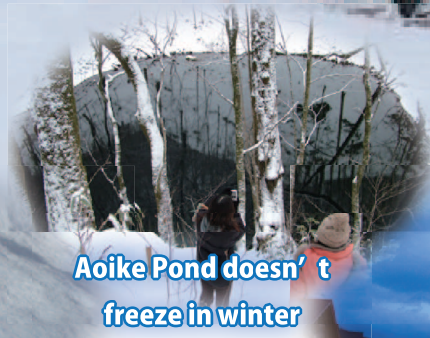
Aoike Pond doesn't freeze in winter